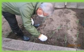
玉ねぎ苗を 植えました