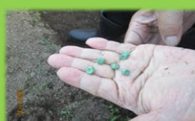
スナップエンドウ の種です