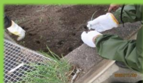
玉ねぎの苗です 一つずつ抜きました

本館屋上に菜園が出来ました。利用者様と一緒に玉ねぎと スナップエンドウを植えました。春に実がなるのが楽しみです。 リハテイ奥の壁にも写真を張っていますので、ご覧ください。