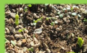
スナップエンドウの 芽が出てきました