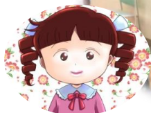
みんなで食べると美味しいねっ