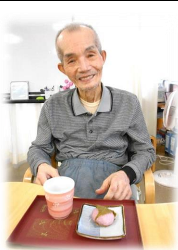
お花見気分、嬉しいね