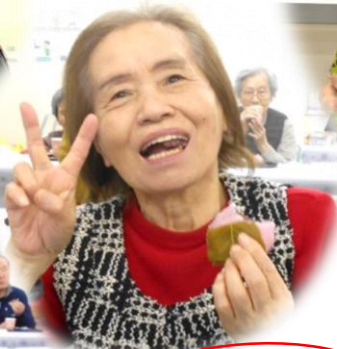
誕生会もありました