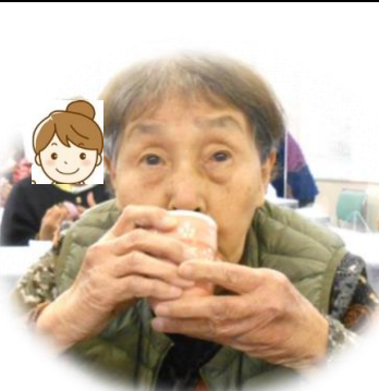
大きな桜餅やったね!