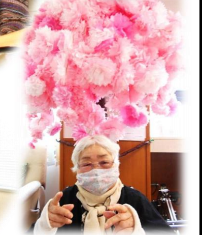
桜より私が勝ったわぁ